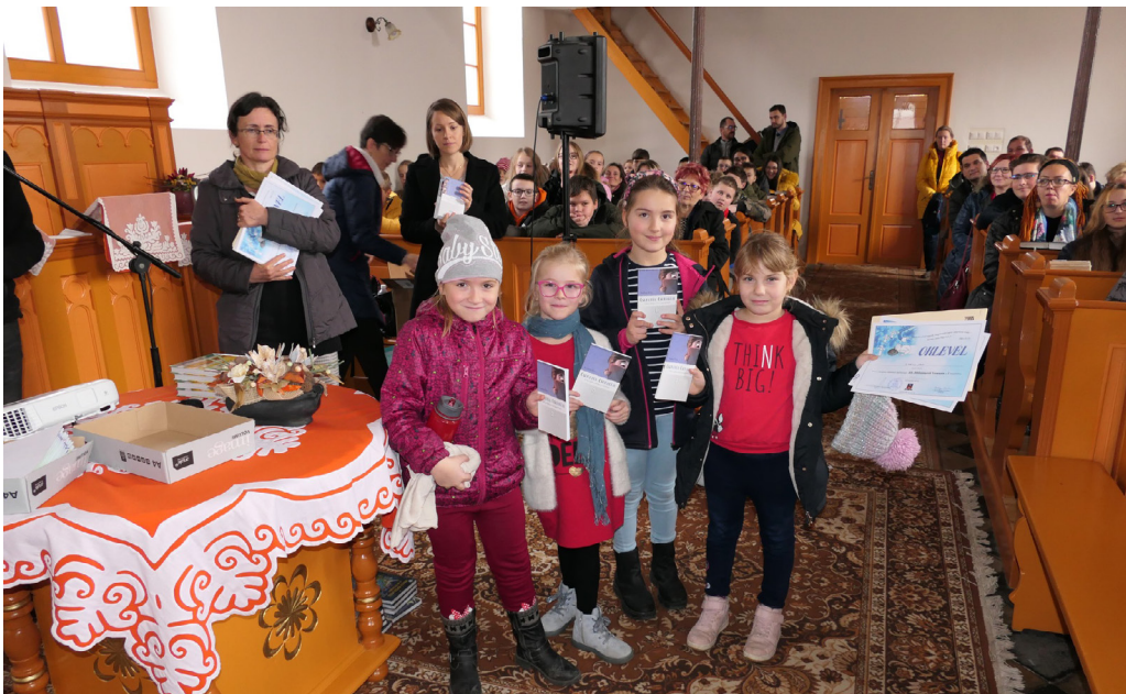
Oklevelek és ajándékkönyvek átadása a templomban.

lasztanunk a versenyt, viszont mindenképp szerettük volna értékelni a csapatok felkészülését, így – hogy fenntartsuk a lelkesedést – a versenyzőket az eredményeik alapján arany-, ezüst- és bronzsávba soroltuk. A visszajelzéseket tekintve: mindenki győztesnek érezte magát. Minden résztvevő egységesen oklevelet és bögrét kapott ajándékba. Az egyházközségek további ajándékokkal jutalmazták a résztvevőket. Mivel a sávokba való besorolás nagyon jó visszhangra lelt, így az idei tanév során is ezt alkalmaztuk. Ajándékként könyvet kaptak a versenyzők, amit az egyházközségek most is további ajándékokkal egészítettek ki.