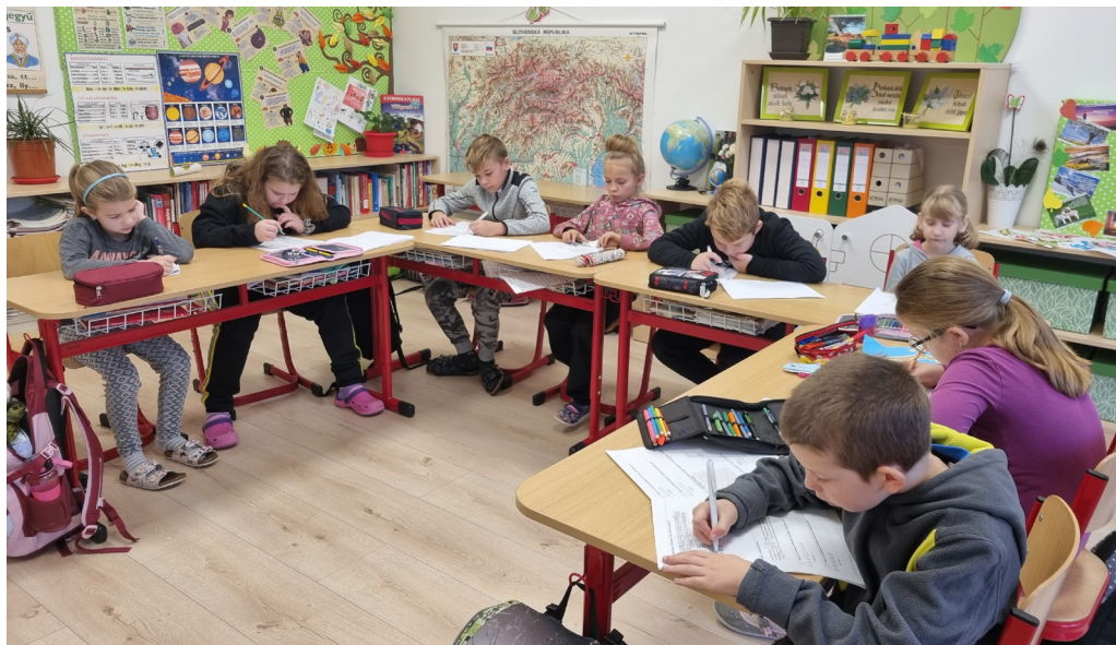
Iskolai forduló a martosói Magyar Tanítási Nyelvű Református Alapiskolában.

Ha szükséges, iskolai/gyülekezeti forduló megszervezése. Előfordul, hogy többen jelentkeznek, mint ahány személyt nevezhetünk. Ebben az esetben iskolai vagy gyülekezeti fordulót rendezek, ahol minden részt vevő oklevelet és dicséretet kap, így nem érzik magukat vesztesnek. A legjobbak alkotják a versenyen induló csapatot.