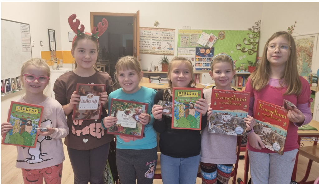
A versenyen való részvételért megjutalmazott tanulók a martosi Magyar Tanítási Nyelvű Református Alapiskolában.

Ugyanígy pozitív élmény a versenyen részt vevő gyerekeknek, ha az egyházközség külön dicséretben, jutalomban részesíti őket. Egyházmegyénkben ez több gyülekezetben a verseny utáni vasárnap történik az istentiszteleten, a gyülekezet jelenlétében.